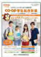
詳しい保障内容につきましては「CO-OP学生組合員」パンフレットでご確認ください。

学生賠償責任保険は、日常生活、正課の講義、インターンシップ中 等における賠償事故を保障する保険です。