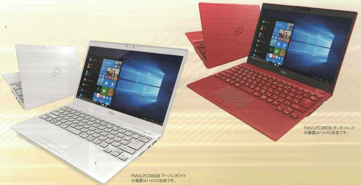
FMVU7C3WDB アーバンホワイト ※画面はハメコミ合成です。