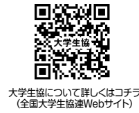
大学生協について詳しくはコチラ (全国大学生協連Webサイト)

3 全てのACI 健康と福祉を 8 働きがいも 経済成長も 11 住み続けられる まちづくりを 16 平和と公正を すべての人に 17 パートナシップで 目標を達成しよう SDGsは、経済・社会・環境の3つの側面で持続可能な開発を進めることを目指しており、開発の中で誰一人取り残さないこと「No one will be left behind」を理念としています。