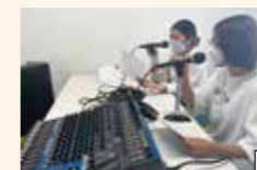
「うめらじ!」収録の様子

津田塾大学放送研究会×生協学生委員会共同企画!「サークルと生協の力で大学生活に彩を」をモットーに、2023年度から店内放送を利用したラジオ「うめらじ!」を行なっております!津田塾生の日常にちょっと役立つゆるトーク、2階うめコープに立ち寄った際には是非耳を傾けてみてくださいね!