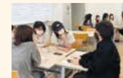
週に1度の英語DAYの様子