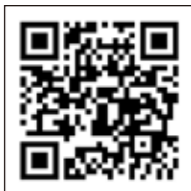
大学生協アプリ(公式) 組合員認証方法