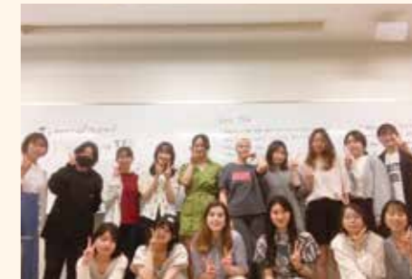
留学生歓迎会の様子

みなさんこんにちは!Tsuda English Dayです。“英語をもっと話したい”という思いから始まりました。学科や学年、また津田にきている留学生とのつながりを生み、交流できる機会を作っています!英語に自信がない...という人、楽しく英語を使いながら、ぜひ一緒に英語スキルを高め合いませんか。毎週行っている活動として、昼休みや空きコマに集まって、英語でお話をする“英語DAY”があります。他にも、月に1回程度、季節に合わせたイベントを実施しています。留学生や学科学年を超えた友達ができる機会がたくさんあります。津田塾大学に入学する皆さん、TED関係者一同、お待ちしております!