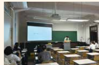
Well Being Campaignの様子

生協学生委員会、通称CCAは「津田塾大学のあらゆる人のよりよい生活をサポートする!」をモットーに日々活動しています。新入生が仲良くなるためのきっかけ作り「ウェルカムパーティー」、1年生部員が中心になって企画した「ビュレグミ総選挙」、津田塾生の心と身体の健康をとことん考えた「Well Being Campaign」など様々な企画を実施してきました! 毎週水曜日の昼休みに、うめコープの奥にある部室でゆるっと会議をしています!興味のある方はぜひお越しください!