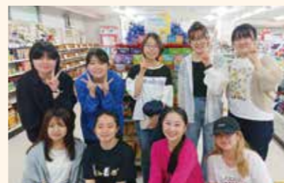
生協学生委員会CCAメンバー