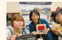
まなナビメンバー

こんにちは!まなキキプロジェクトです!現在は大学内外で学びを広げるイベントを開催しています。そんな私たちからは、まなキキプレゼントとナッツが皆さんの学びのお供します!一緒に学びを盛り上げていきましょう!