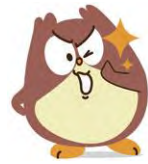
大学生協共済 キャラクター 「タスロー」