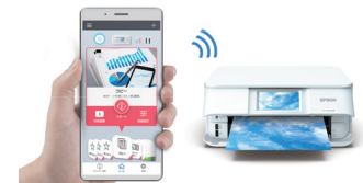
(注) 画像はEP-882AWです。 (注) 画像はイメージです。変更される可能性があります。

アプリを使えばプリンターをスマホで操作可能。いつものスマホで直感的にコントロールできます。