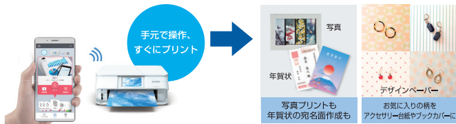
(注)画像はEP-882AWです。(注)画像はイメージです。変更される可能性があります。

自分のメモや友達とシェアした画像・授業資料などをスマホから簡単手軽に印刷できます。プリンターとのカンタン接続・操作ができる「Epson Smart Panel」で、忙しい大学生活を支えます。