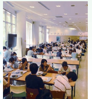
↑大きな窓で明るい「カフェテリアグリーン」

○アグリ(購買書籍部) 弁当・おにぎり・サンドイッチ・パン・サラダ・飲料等が購入可能。 ※菓子類・カップ麺等は利用不可。