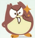
大学生協共済キャラクター「タスロー」