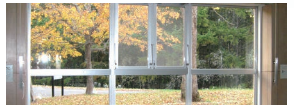
冬は雪景色を見ながら、あたたかいご飯が食べられます