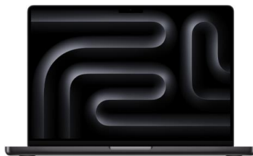
スペースブラック