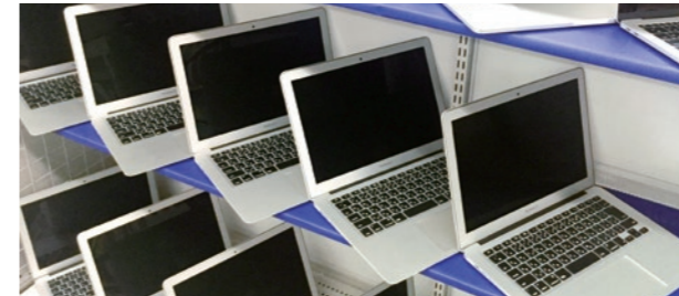
藤沢店で用意している代替機(MacBook Pro・MacBook Air)

修理受付は藤沢店にお持ちいただくだけです。もしくはWeb受付で郵送対応もしています。修理期間中はその場ですぐに無料でパソコンをお貸出ししますので、授業やレポートなどで困ることがありません。