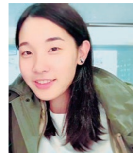
環境情報学部 4年生