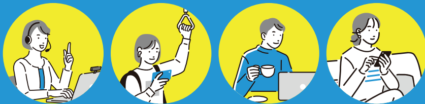
オンライン 授業・面接

ご自宅・外出時のインターネットは データ容量無制限の WiMAX+5Gにおまかせ!