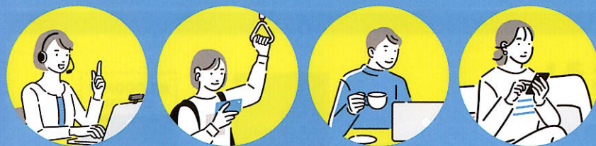
オンライン 授業・面接