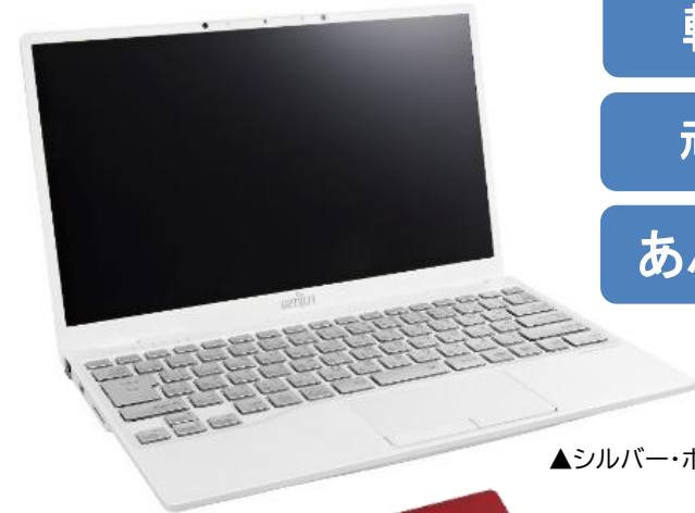
▲シルバー・ホワイト