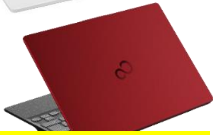
▲ガーネットレッド