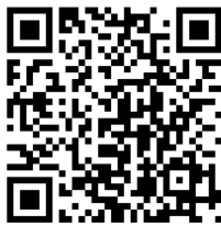
▲詳細はこちらから

[生協オリジナルセット] インナーバッグ USBメモリ(8GB) 4年間のメーカー保証+動産保険 セットアップサポート 無料セットアップマニュアル