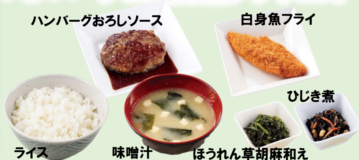
ハンバーグおろしソース