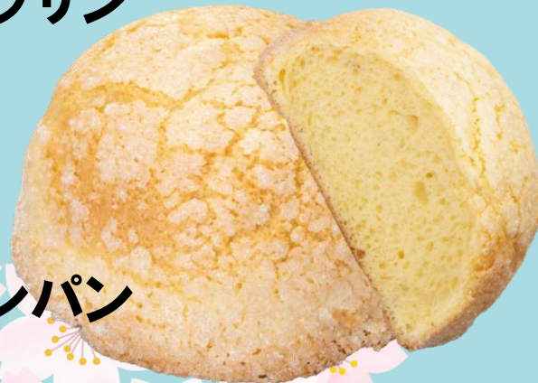
しっとりメロンパン