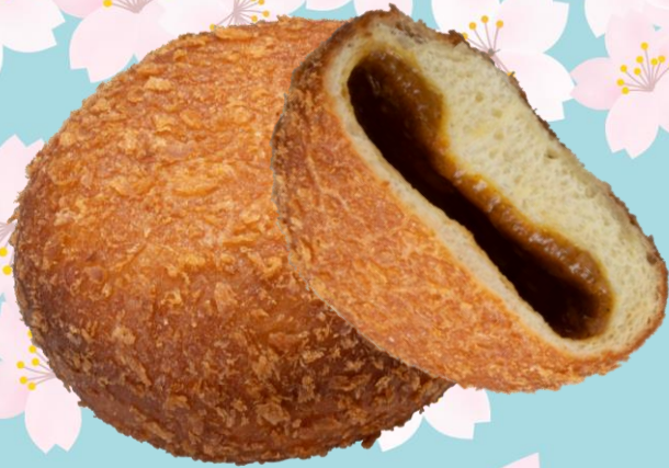
ビーフカレーパン