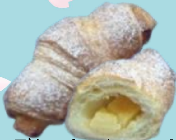
チーズケーキのクロワッサン