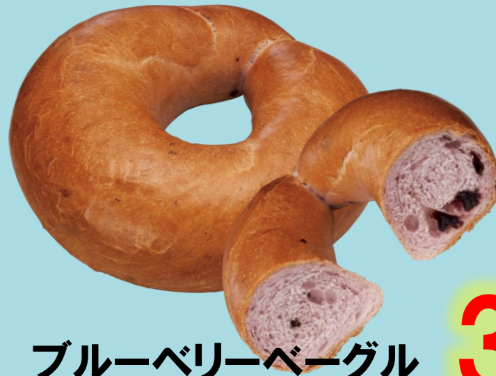
ブルーベリーベーグル