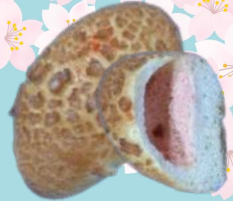
明太チーズダッチパン