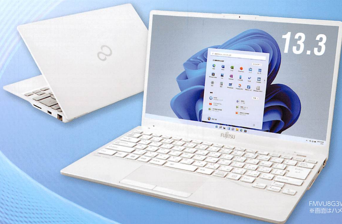
FMVU8G3WD4 シルバーホワイト ※画面はハメコミ合成です。